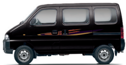
பேர்ன் மிட்நைட் பிளாக்