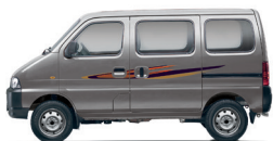
மெட்டாலிக் கிளிஸ்ட்னிங் க்ரே