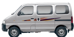
മെറ്റാലിക് സിൽക്കി സിൽവർ